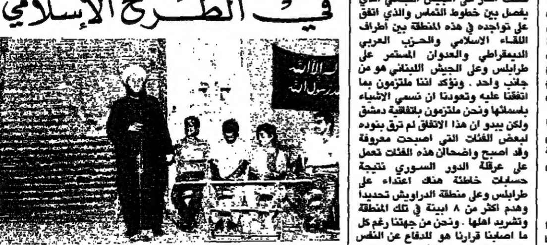
الشيخ عبدالحليم زيدان يلقى كلمة

مركبة يحاك لها في مدينتنا تقول لولا المسلمين العلماء. اننا نفضل الله وبفضل شهادتنا الابرار اسفلنا من نواحي صعوبات بلحاك للفرار. وتنتهج اليوم مواجهة هذه الفتنة التي تحاك ضنا. واصفا ان اعداء الاسلام كثيرين لا يعون ولا يحسون بديارهم ولا بالملح والخراب والقتل والتشريد في كل وقت. واكد اننا ان نخلع عن قلوبنا الفسيفسائية لان هذه القضية قضيتنا والمسجد الاقصي مسجنا.